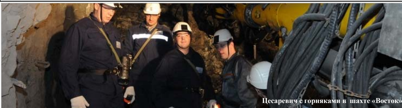
Цесаревич с горняками в шахте «Восток»

Его Императорское Высочество прибыл на Родину с целью посещения Москвы и г.Норильска для ознакомления с работой предприятий ОАО «ГМК «Норильский Никель» и обсуждения с руководством компании стратегии защиты российских экономических интересов в учреждениях Европейского Союза.