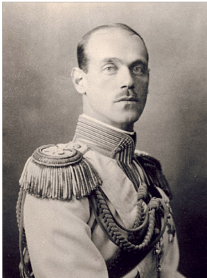
Е.И.В. Государь Великий Князь Михаил Александрович