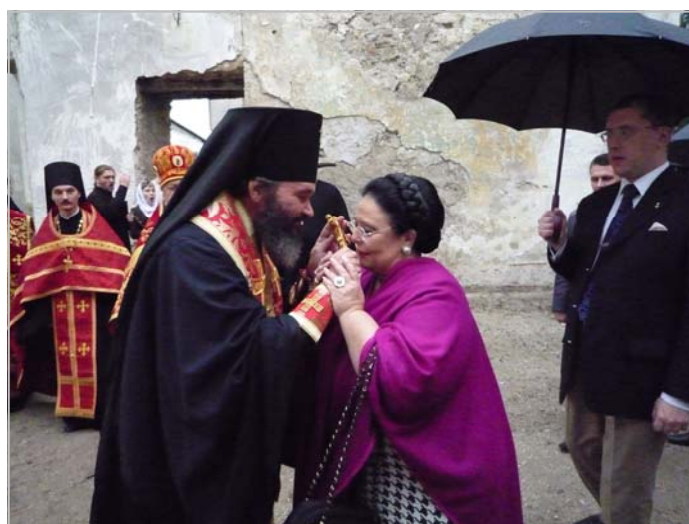
Архиепископ Юстиниан приветствует Государыню

Божественная литургия завершилась пасхальным крестным ходом духовенства, высоких гостей и многочисленных верующих вокруг новоосвященной церкви. По завершении богослужения Архиепископ Юстиниан обратился