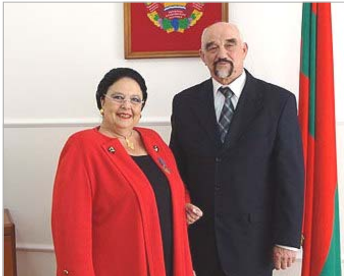
Глава Императорского Дома и Президент И.Н.Смирнов