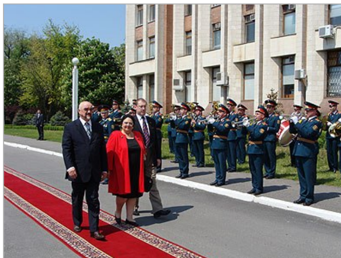
Президент ПМР встречает Главу Императорского Дома

Высочайший визит Главы Дома Романовых на Приднестровскую землю начался с молитвы. 6 мая, в Праздник святого великомученика Георгия Победоносца, в День