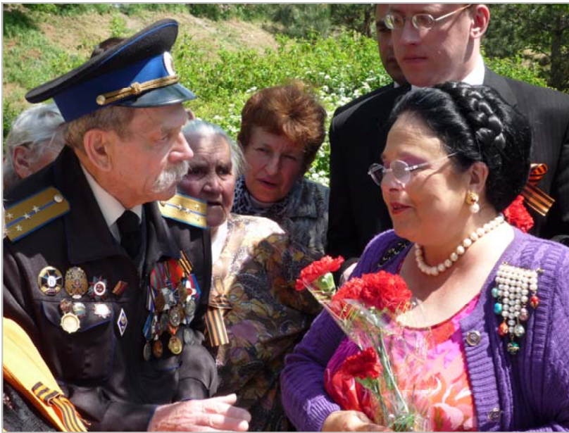
9 мая 2009 г.

После официального обеда в честь Главы Дома Романовых Ее Императорское Высочество встретила с воспитанниками и педагогами Бендерского детского дома. Во второй половине дня Государыня приняла участие в официальной церемонии на территории Военно-исторического мемориального комплекса Бендер, где возложила знаки Императорского Военного Ордена Святого Николая Чудотворца III степени на новопожалованных кавалеров: вице-