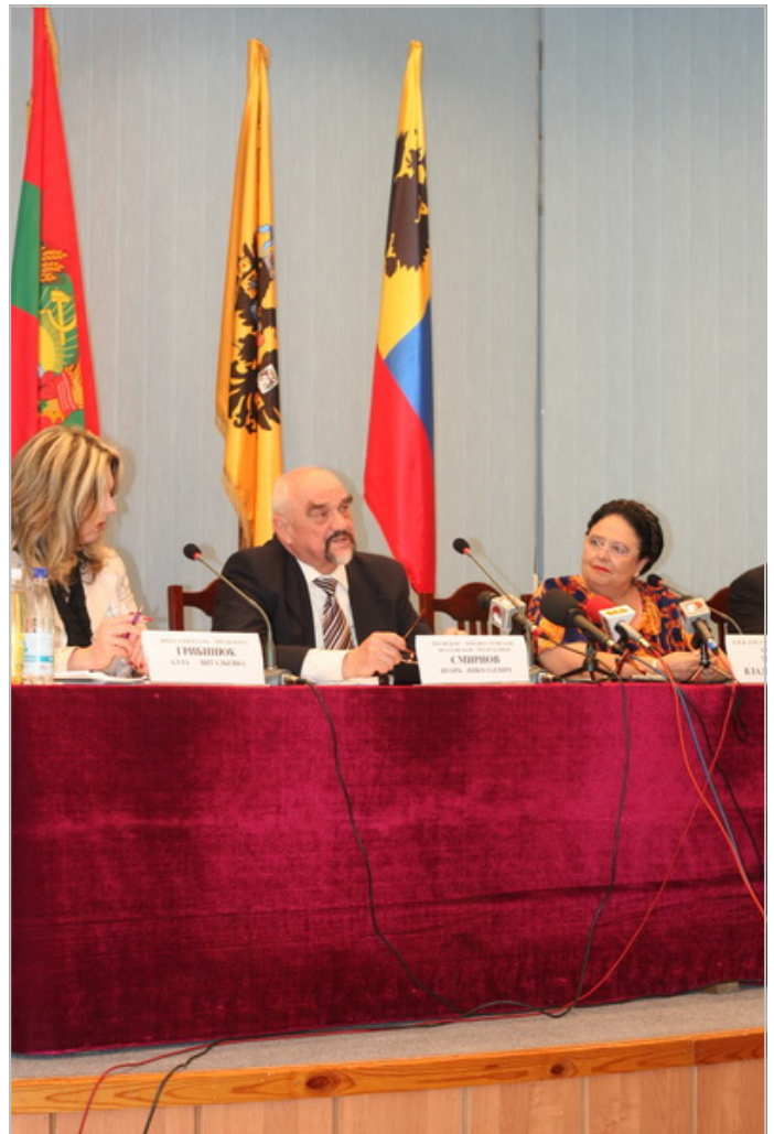
Пресс-конференция Государыни и Президента ПМР

После трапезы, данной Митрополитом Владимиром, Великая Княгиня направилась в расположение Миротворческих Сил Российской Федерации в Бендерах, где перед строем миротворцев возложила знаки Императорского Ордена Святой Анны III степени на старшего военного начальника воинского контингента Миротворческих сил