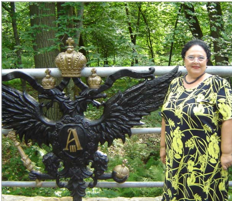
Государыня в Беловежской Пуше на мосту построенном специально к приезду Ее Августейшего Пращура