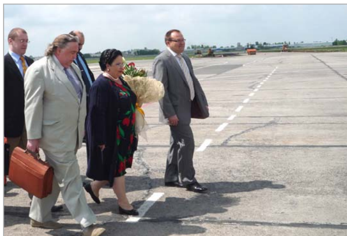
Прилет в Киев