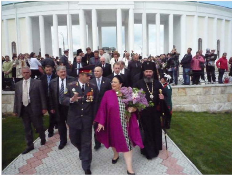
Государыня посещает Военно-исторический комплекс в Бендерах.

Глава Российского Императорского Дома возложила на С.Е.Нарышкина знаки Императорского Ордена Святой Анны I степени во свидетельство Своего глубокого уважения к его трудам на благо Отечества. Затем Ее Императорское Высочество поклонилась гробницам своих Царственных Предков в Архангельском соборе, помолилась в Успенском соборе, посетила Патриаршие Палаты и осмотрела выставку сокровищ Династии Великих Моголов из собрания Эмиров Кувейта и Королевских музеев Великобритании.