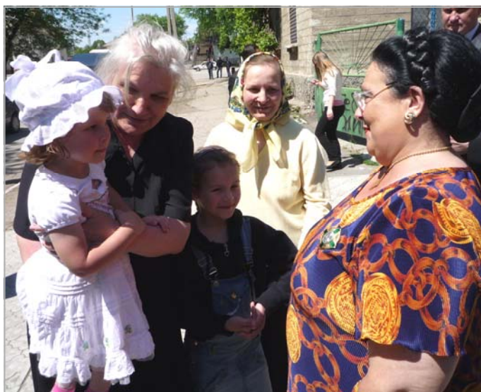
На улице г.Бендер

Вечером в помещении Дома детского и юношеского творчества Тирасполя состоялся официальный прием в честь Главы Российского Императорского Дома от имени