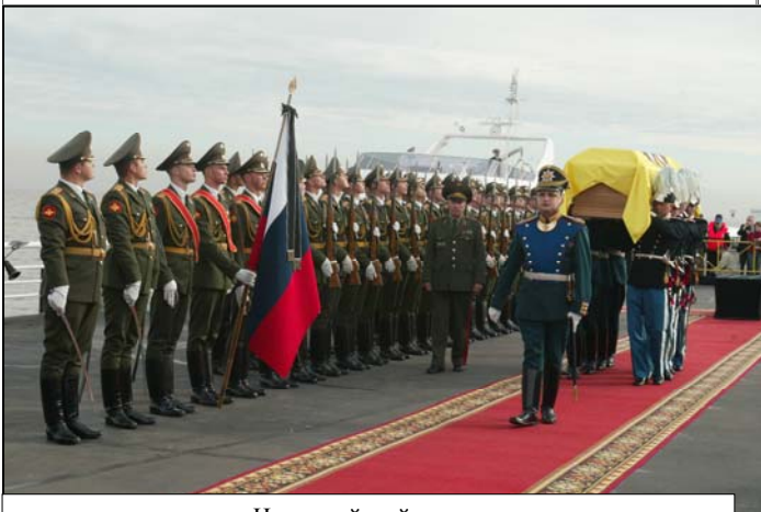
На российской земле.

В Санкт-Петербурге памятник был открыт в связи с 125-летием почетного шефства Вдовствующей Государыни над Кавалергардским полком, носившем Ее имя, и установлен в здании быв. Кавалергардских казарм (Шпалерная ул., 41).