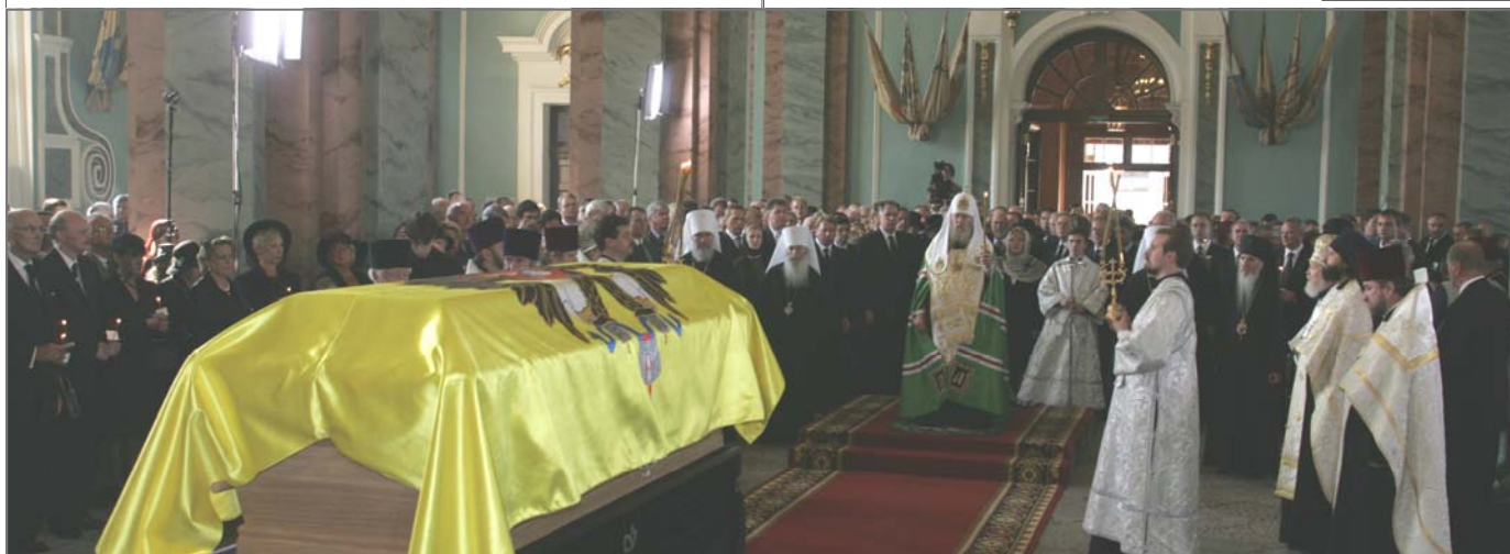
Во время церемонии предания праха земле в Петропавловском соборе С-Петербурга.