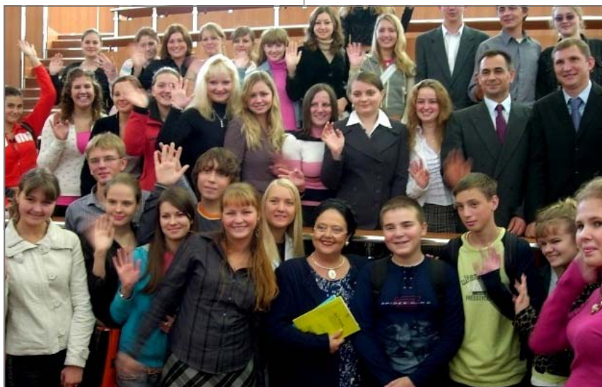
С одинцовскими студентами.

Затем Ее Императорское Высочество направилась в Одинцовский Гуманитарный Университет, основанный в 2004 году. Среди российских университетов он самый молодой и один из немногих муниципальных университетов страны. ОГУ имеет 2 факультета: государственного и муниципального управления и факультет экономики и менеджмента. Государыня осмотрела учебные аудитории, университетскую библиотеку и единственный в России музей поэта Э.А.Асадова. Ректор И.И.Русин рассказал