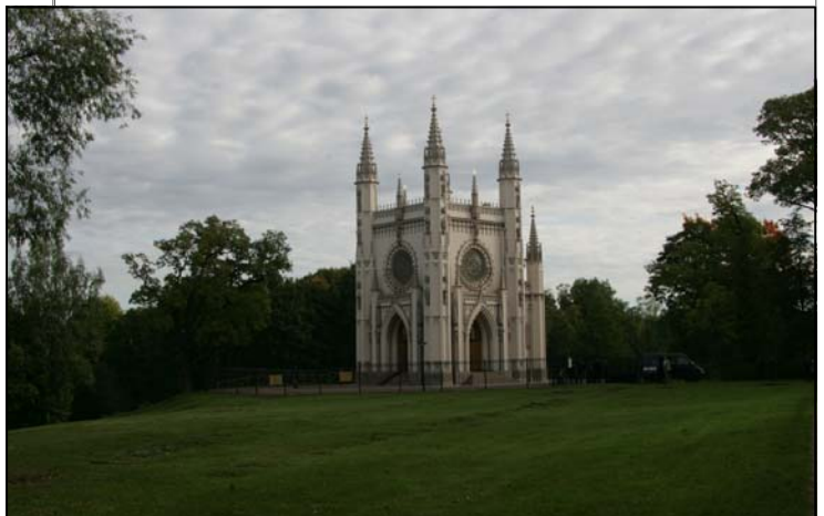
Храм Св.Князя Александра Невского в г.Петергофе.