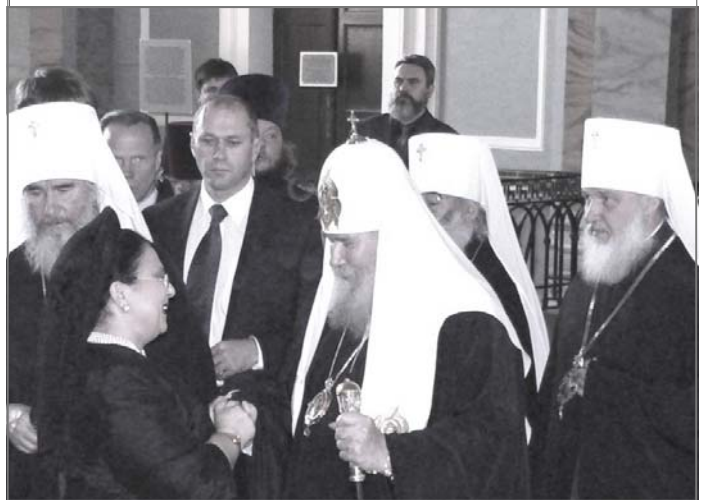
Святейший Патриарх приветствует Главу Императорского Дома.

При осмотре собора и Великокняжеской усыпальницы Главу Российского Императорского Дома сопровождал директор музея «Петропавловская крепость» Б.С.Аракчеев. Государыня высказала глубокую обеспокоенность катастрофическим состоянием Великокняжеской Усыпальницы Петропавловского собора и сообщила присутствующим официальным лицам и представителям средств массовой информации, что она обратилась с письмами по этому поводу к Президенту Российской Федерации В.В.Путину, Святейшему Патриарху Московскому и всея Руси Алексию II, к первому