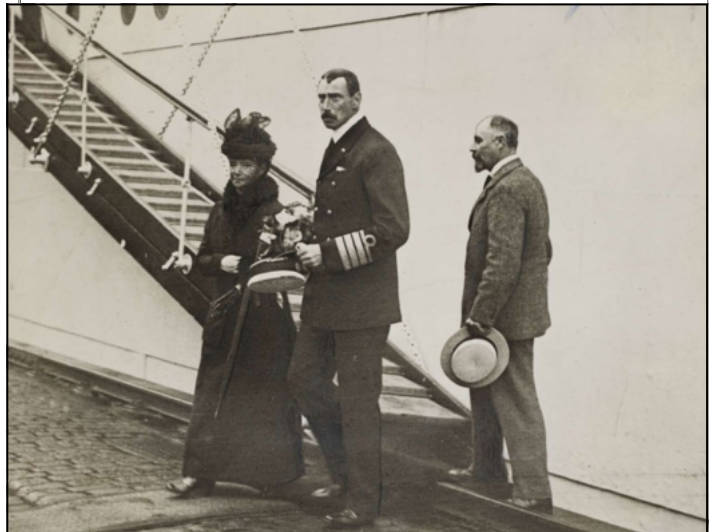
1919 г. Король Кристиан X встречает Императрицу в Копенгагене.

Ранним утром 23 сентября восемь офицеров, поровну от Датской Королевской гвардии и Российского президентского полка, внесли гроб в кафедральный собор Роскильда. В почетный караул заступили шесть датских генералов и ад-