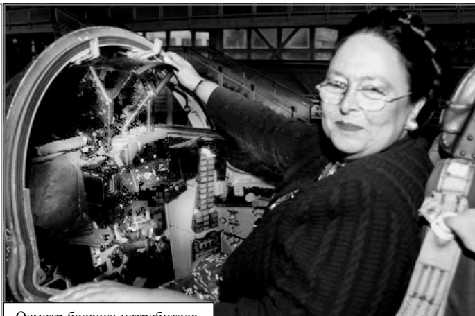
Осмотр боевого истребителя.

Эти пилотажные группы, основанные в начале 1990-х гг., регулярно проводят показательные полеты в небе России и за ее пределами. Зрители многих стран мира рукоплескали мастерству летчиков. Уникальность этих групп состоит в том, что они единственные в мире, выполняющие групповой выший пилотаж на самолетах класса тяжелых истребителей.