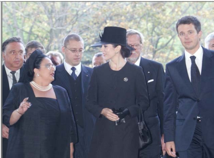
Прибытие Государыни и Крон-Принца Датского с супругой на церемонию.

28 сентября состоялось перезахоронение священных останков Ее Величества Вдовствующей Государыни Императрицы Марии Феодоровны. Глава Российского Императорского Дома прибыла в Исаакиевский собор, где приветствовала и поблагодарила сопровождавших гроб Вдовствующей Императрицы Наследника Датского Престола Е.К.В. Крон-Принца Фридерика и его супругу Е.К.В. Крон-Принцессу Марию-Елизавету и министра иностранных дел Дании Пера Стига Меллера. На панихиде, отслуженной Его Святейшеством Святейшим Патриархом Московским и всея Руси Алексием II и сонмом духовенства, рядом с Главой Российского Императорского Дома Великой Княгиней Марией Владимировной и Крон-Принцем Фридериком с Крон-Принцессой Марией-Елизаветой молились Его Величество Король Эллинов Константин II (крестный отец Е.И.В. Государя Наследника Цесаревича и Великого Князя Георгия Михайловича) и Его супруга Ее Величество Королева Анна-Мария (урожденная Принцесса Датская, сестра ныне здравствующей Королевы Дании Маргариты), Е.К.В. Принц Майкл Кентский и его супруга Е.К.В. Принцесса Мария-Кристина (урожденная баронесса фон Рейбниц), Министр культуры РФ А.С.Соколов, Губернатор Санкт-Петербурга В.И.Матвиенко, представители государственных учреждений России и Дании и дипломатическо-