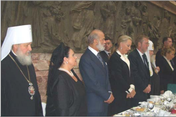
На поминальной трапезе.

Начало, с. 7. заверениями о готовности помогать в Ее царственном служении Родине. Во время этой беседы, а также отвечая на вопросы корреспондентов отечественных и зарубежных средств массовой информации Глава Российского Императорского Дома сказала, что испытывает по отношению к Своим морганатическим родственникам самые добрые чувства, готова сотрудничать с ними на благо России и надеется, что все потомки Императоров Всероссийских, независимо от их династического статуса, объединят свои усилия на основе патриотизма и уважения к традициям и законам Российского Императорского Дома.