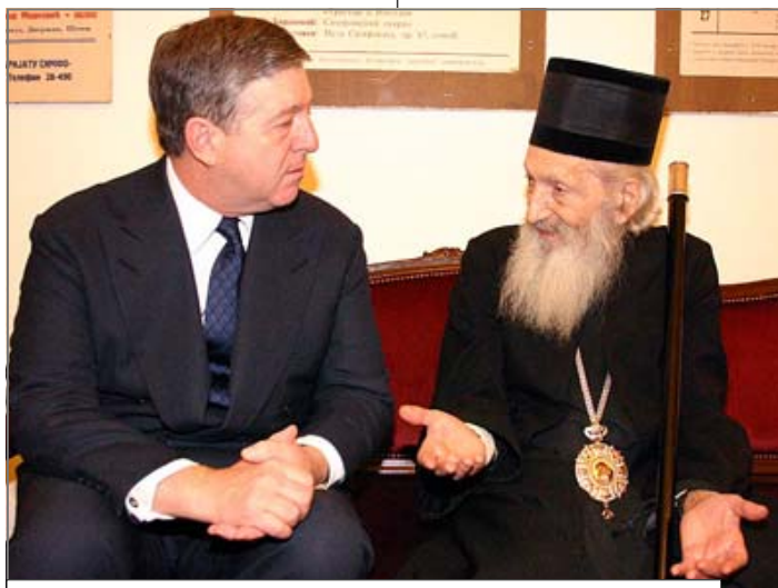
Крон-Принц Александр и Патриарх Сербский

За эти годы я встречался со многими политическими деятелями, и интересная вещь - в наших политических партиях много людей, которые одобрили бы конституционную Монархию, но не хватает понимания ее демократических выгод и не хватает информации о том, как монархическая система работает, например, в Испании, Великобритании, Швеции, Дании и т.д. Кроме того, каждый должен понять, что для Монарха нет никакой исключительности или привилегии в отношении какой-либо политической группы. Для всех он дружественная