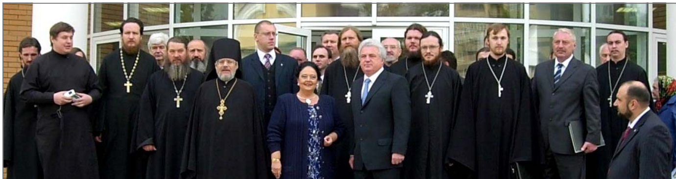
Одинцовские власти и благочиние встречает Государыню.

произнес здравицу в честь Главы Российского Императорского Дома и Русского народа, призвавшего на царство Династию Романовых.