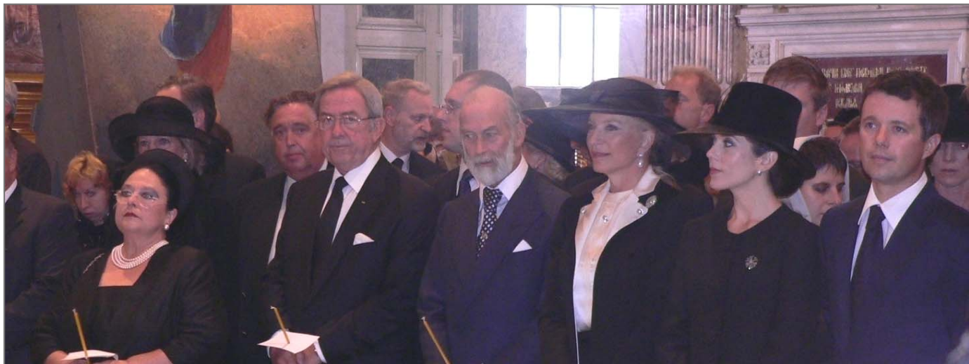
Почетные гости на церемонии перезахоронения: Глава Российского Императорского Дома Е.И.В. Государыня Великая Княгиня Мария Владимировна, Е.И.В. Король Греции Константин, Е.К.В. Принц Майкл Кентский с супругой, Е.К.В. Крон-Принцесса Мария -Елизавета и Е.К.В. Крон-Принц Фредерик Датские.

На следующий день 28 сентября состоялась церемония предания праха земле. После выноса гроба из храма Св.Александра Невского траурная процессия направилась в Санкт-Петербург. По дороге кортеж сделал остановку в любимой императорской резиденции - Царском Селе, тем самым, повторяя первый путь Принцессы Датской по русской земле 140 лет назад. Затем саркофаг, накрытый императорским штандартом, был доставлен в Исаакиевский собор Санкт-Петербурга где его встречали Патриарх Московский и всея Руси Алексей II, Глава Российского Императорского Дома Е.И.В. Государыня Великая Княгиня Мария Владимировна и Е.К.В. Крон-Принц Фредерик Датский с супругой Крон-Принцессой Марией –Елизаветой.