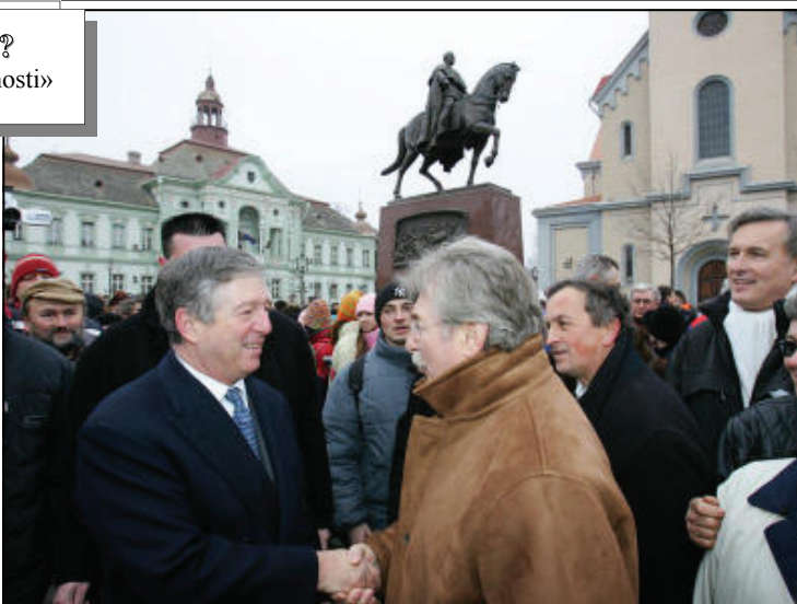
Крон-Принц Александр II на открытии памятника Королю Петру I Освободителю