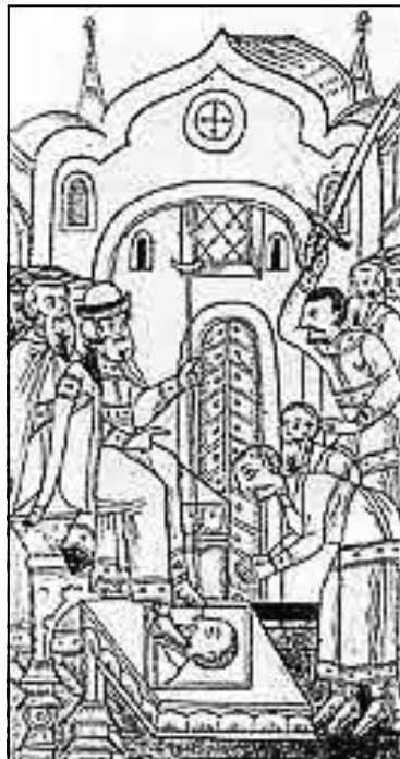
Иван III топчет ханскую басму. Миниатюра XVII века

Во внешней политике Ивана III можно выделить три основных направления: борьба за свержение ига Золотой Орды, борьба с Великим Княжеством Литовским за возврат захваченных им русских, украинских и белорусских земель, а также борьба с Ливонским орденом за выход к Балтийскому морю.