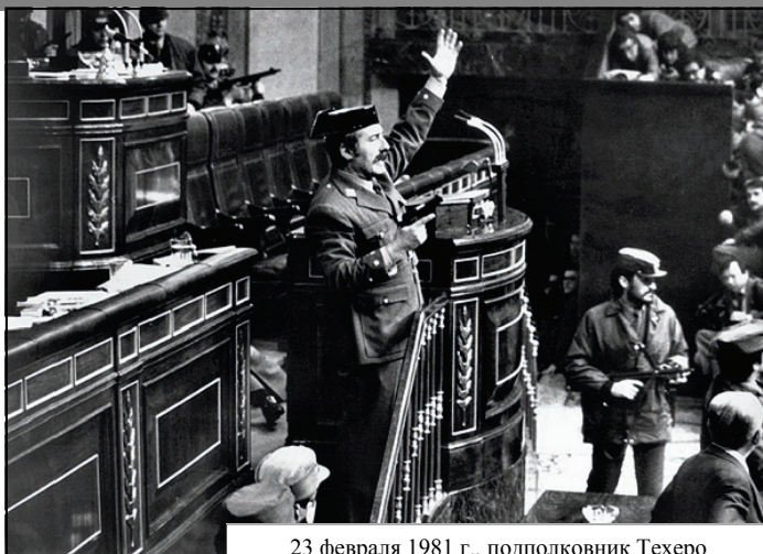
23 февраля 1981 г., подполковник Техеро захватывает здание Кортесов

23 февраля 1981 года подполковник Техеро с группой гвардейцев захватил здание Кортесов и арестовал депутатов и членов кабинета министров. Подразделения бронетанковой дивизии “Брунете” захватили телецентр и ряд других стратегических объектов Мадрида. Контроль над Валенсией захватил генерал Хайме Миланс дель-Боск, который вывел на улицы города 1800 солдат и офицеров. Казалось, что Королевство вот-вот вернется во времена диктатуры. Однако абсолютно неожиданной и непреодолимой для путчистов оказалась позиция Короля, с самого захвата Кортесов оказавшего им активное сопротивление. Прислушавшись к Его призыву, авиация, флот, а также большинство преданных Королю сухопутных сил страны отказало заговорщикам в поддержке, а командование дивизии “Брунете” освободило телецентр и вывело войска из Мадрида. Король Хуан Карлос, лишенный ранее возможности обратиться ко всей стране, выступил в форме Верховного Главнокомандующего по телевидению и призвал испанцев оказать сопротивление заговорщикам.