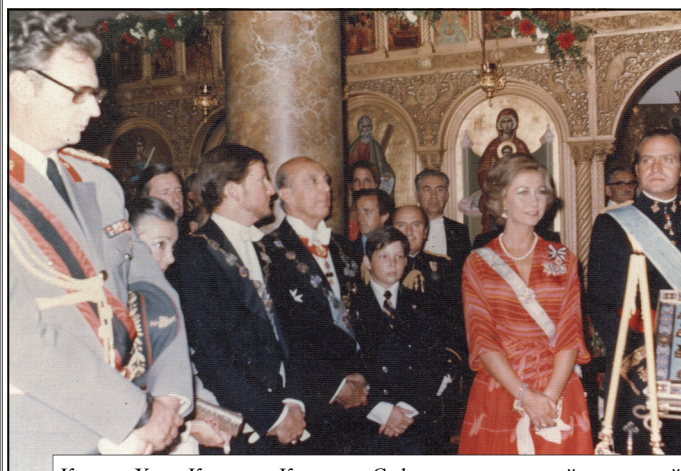
Король Хуан Карлос и Королева София среди августейших гостей на свадьбе Е.И.В. Великой Княгини Марии Владимировны

Не стоит забывать, что такое сближение с Испанией особенно важно в связи с тем, что эта страна официаль-но пребывания Главы Российского Императорского Дома Великой Княгини Марии Владимировны.