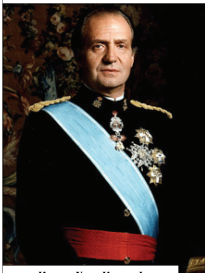
Король Хуан Карлос I

так и в Испании; энергетический вопрос, а также роль России как председателя в “большой восьмер-ке” в решении таких мировых проблем, как массовые забо-левания, ухудшение экологии, бедность, неравенство. Перед началом визита Король Хуан Кар-лос I особо отметил: “Я уверен в том, что имеются большие возможности для увеличения участия