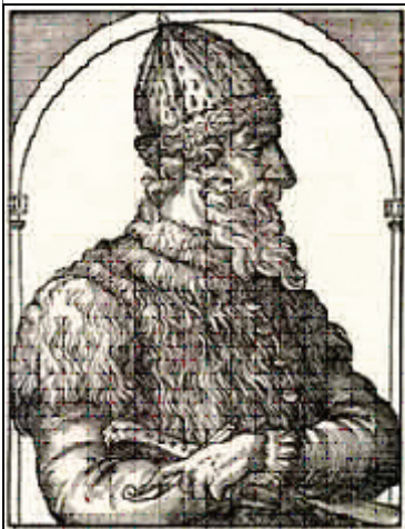
Иван III. Миниатюра из книги С.Герберштейна. XVI в.

Будущий «Государь всея Руси» Иоанн III, который, по словам Н.М.Карамзина, «имел редкое счастье властвовать сорок три года и был достоин оно, властвуя для величия и славы россиян», появился на свет в годы войн и смут. И о его рождении, поглощенный водоворотом политический событий, летописец обронил в 1440 году лишь скупую фразу: «Родился Великому Князю сын Иван генваря 22».