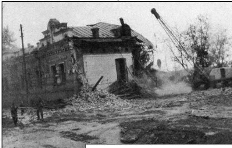
16 сентября 1977 г. разрушение дома Ипатьева

«По моему глубокому убеждению, новая российская власть просто обязана реабилитировать Императора Николая II и его семью – как по юридическим, так и нравственным соображениям...»