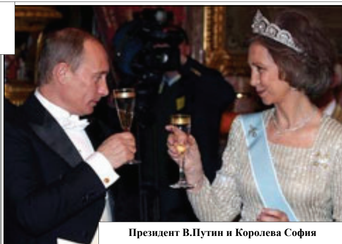
Президент В.Путин и Королева София

испанских компаний в российском рынке, особенно в та-ких секторах, как энергетика, транспорт и туризм”. По мнению многих экспертов, несмотря на активную деловую кооперацию между Россией и Испанией, имеется еще немало сфер для эффективного сотрудничества.