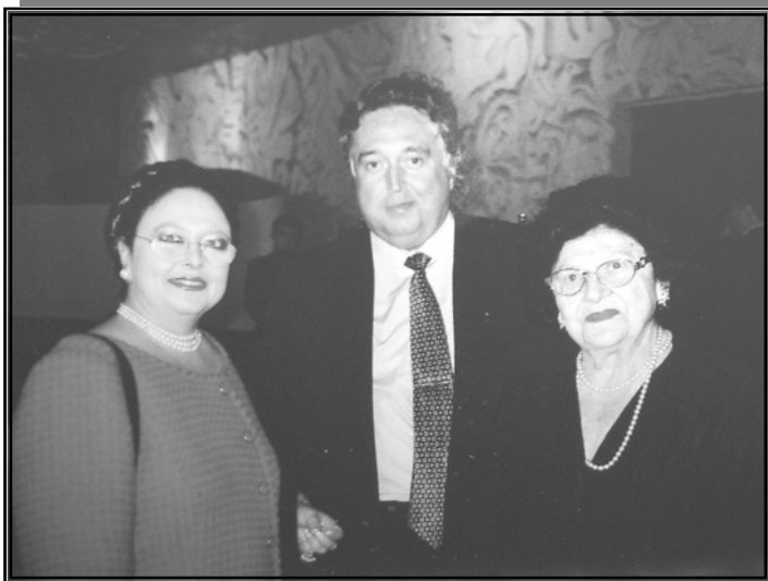
Государыня Мария Владимировна, Вдовствующая Великая Княгиня Леонида Георгиевна и князь Вадим Олегович Лопухин во время Высочайшего визита в Смоленск в 2003 г.

В связи с этим, Глава Российского Императорского Дома Е.И.В. Государыня Великая Княгиня Мария Владимировна удостоила его Высочайшего Всемилостивейшего Рескрипта.