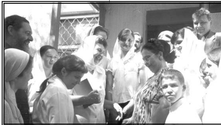
Государыня с детьми и сотрудниками приюта «Дом Милосердия» в г. Волжском. Июль 2003 г.

Вечером того же дня представителей Главы Российского Императорского Дома принял Глава администрации Волгоградской области